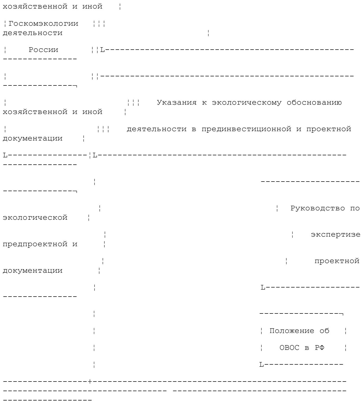
Рис. 2. Принципиальная схема нормативно-методического обеспечения экологического сопровождения инвестиционно-строительных проектов